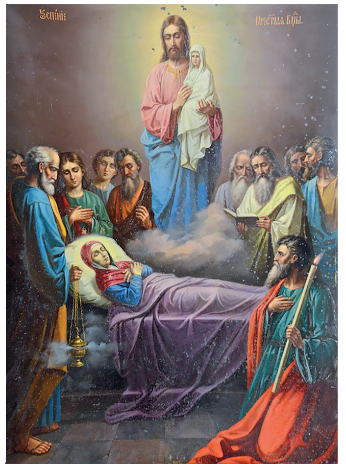
«Успіння Богородиці», 1897 р. Оцинковане залізо, олія. Походить з Успінської церкви с. Сокіл Рожищанського благочиння